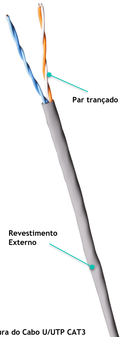
Figura do Cabo U/UTP CAT3