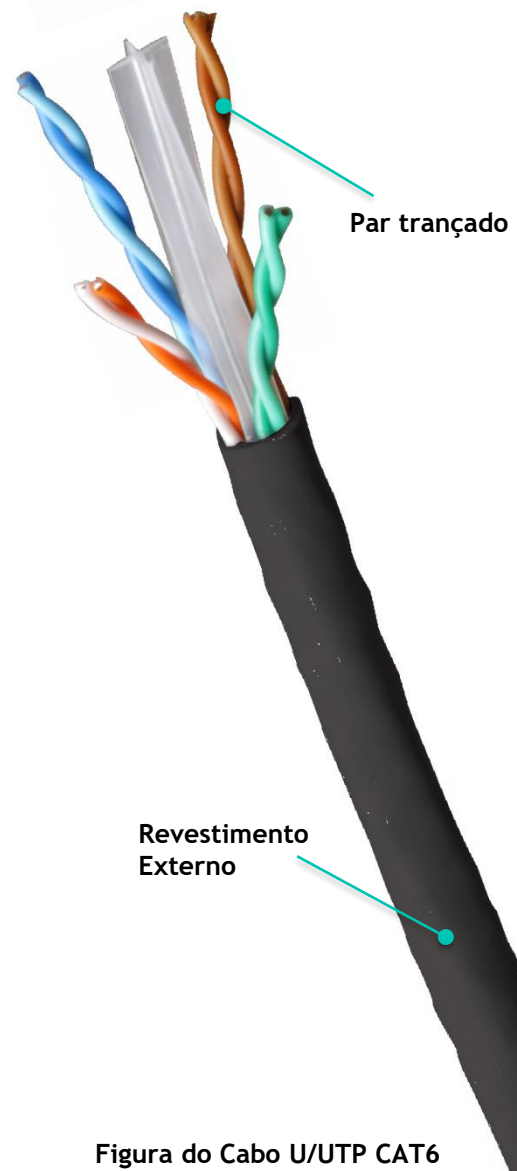
Figura do Cabo U/UTP CAT6