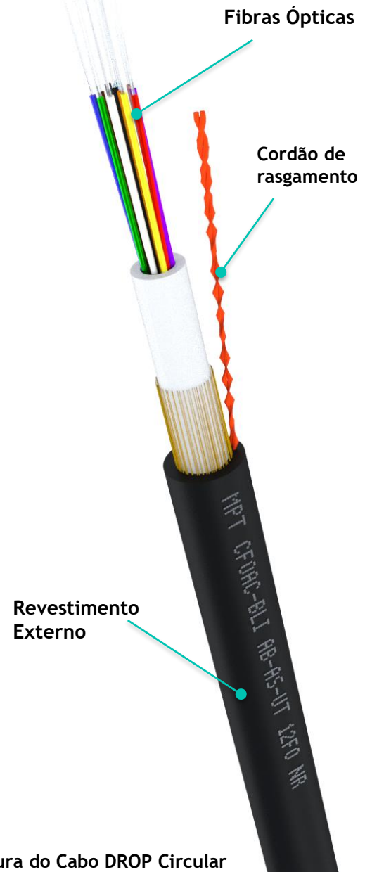
Figura do Cabo DROP Circular