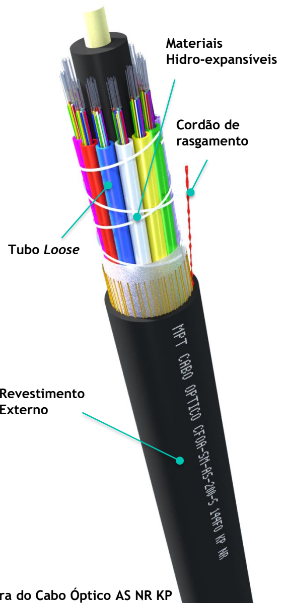
Figura do Cabo Óptico AS NR KP